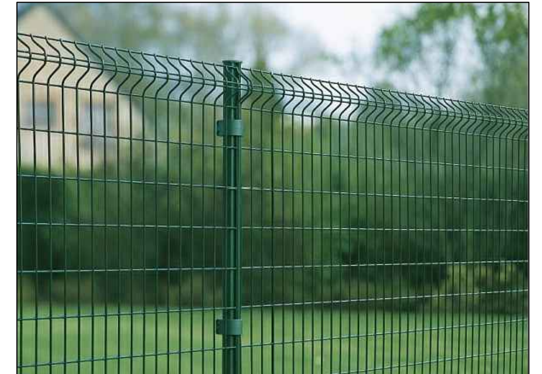
DETAL NR 4 - OGRODZENIE PANELOWE