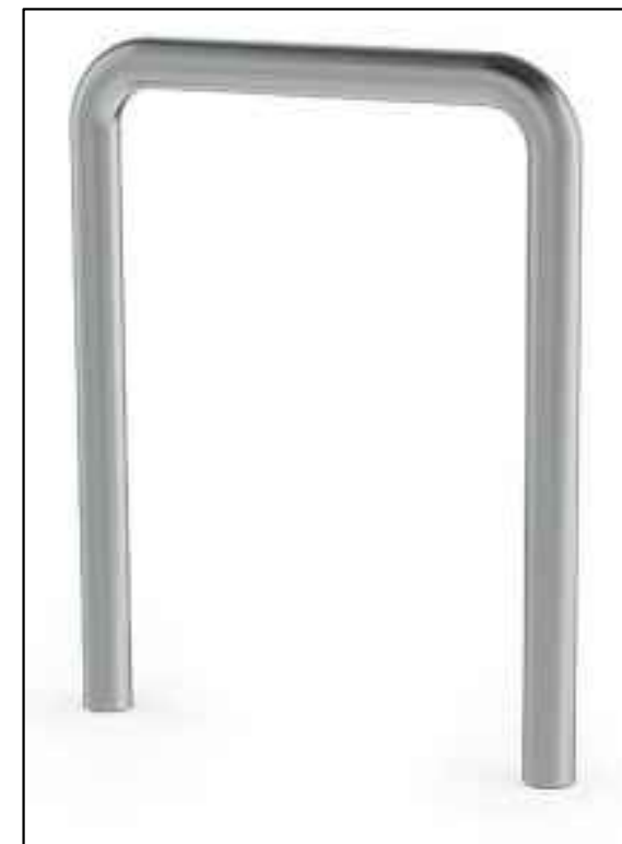
DETAL NR 6 - STOJAK ROWEROWY ZE STALI NIERDZEWNEJ