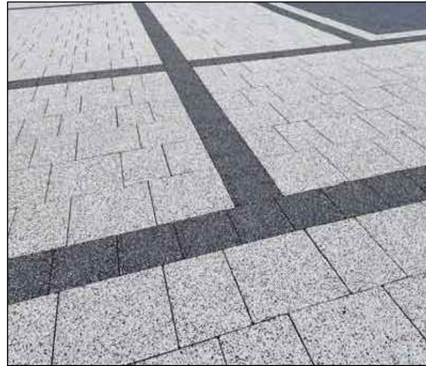
DETAL NR 2 - POLBRUK COMPLEX