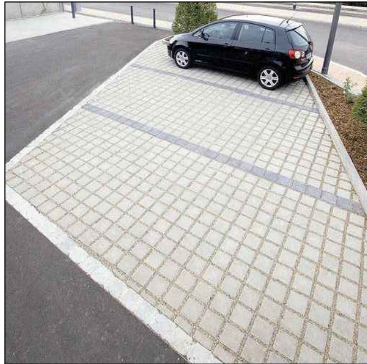
DETAL NR 1 - EKOL NAWIERZCHNIA PRZEPUSZCZALNA