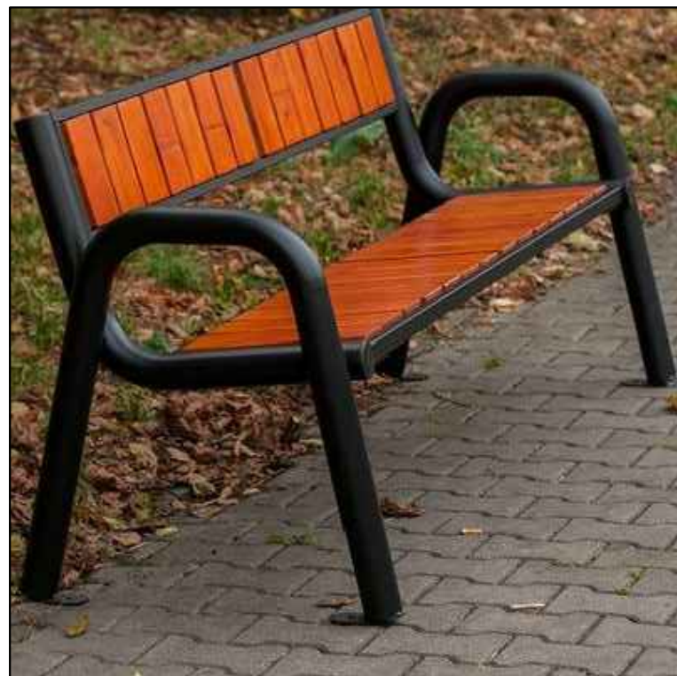
DETAL NR 5 - ŁAWKA STALOWO-DREWNIANA