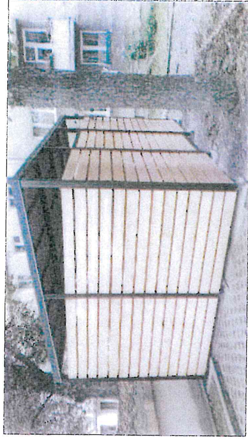
ZDJĘCIE ANALOGICZNEJ WIATY ŚMIENIKOWEJ

KOLOR KONSTRUKCJI STALOWEJ: GRAFITOWY KOLOR WYPEŁNIENIA DREWNIANEGO: DREWNIANY/BRAŹ DESKI WYHEBLowane, ZAIMPREGOWANE KONSTRUKCJA STALOWA OCYNKOWANA I MALOWANA PROSZKOWO